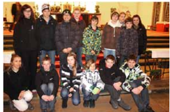
Die Wattenberger Firmlinge