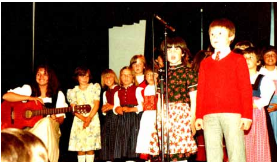
Muttertagsfeier in der „Säge“ 1982