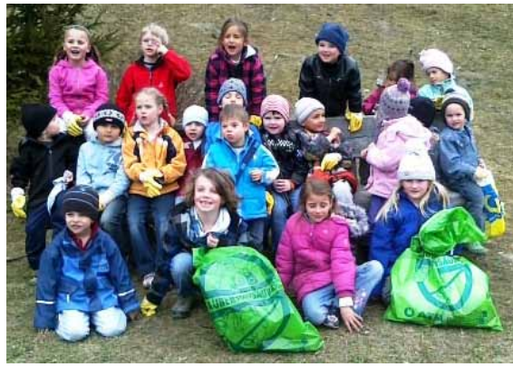
„Sauber statt Saubär“