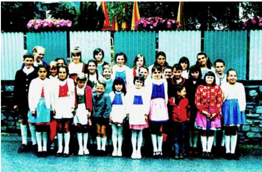
Jugendsingen in Wattens am 19.6.1971 ( VS-Wattenberg)