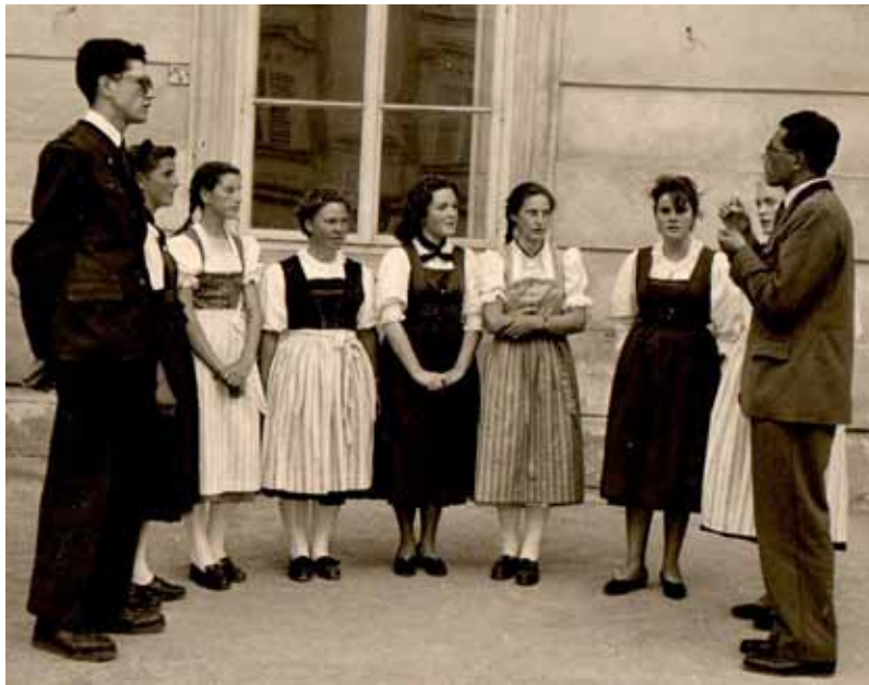
Erinnerung an das Sängertreffen in Innsbruck 1956 (Volkliedersingen auf der Straße)