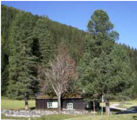
Gedenkbäume in Walchen

Im Jahre 1908 beging die österreichisch-ungarische Monarchie das 60-jährige Regierungsjubiläum von Kaiser Franz-Josef I. Dieser hatte 1848 den Habsburger Thron bestiegen und das Kaiserreich während seiner langjährigen Regierungszeit zu einem glanzvollen Aufschwung geführt. Aus Dankbarkeit dem greisen und beliebten Landesvater gegenüber fanden allerorts Feierlichkeiten statt, und Gedenksteine, Brunnen, Kapellen, Sozialanstalten wurden errichtet. Ihm zu Ehren wurden auch unzählige „Gedenkbäume“ gepflanzt, von denen viele bis heute überlebt haben.