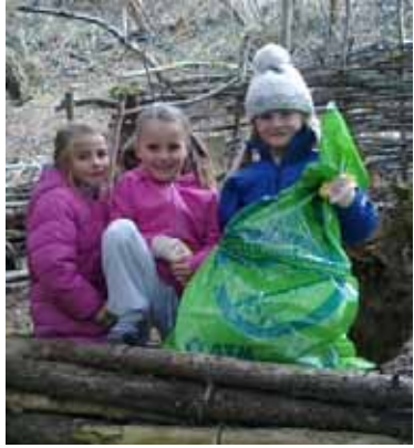
„Sauber statt Saubär“