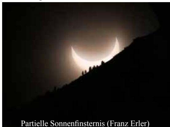
Partielle Sonnenfinsternis (Franz Erler)

In diesem Sinne wünsche ich allen WattenbergerInnen ein frohes Osterfest und viel Zeit für Wesentliches.