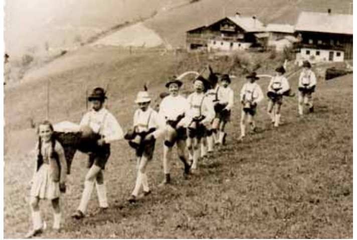
Grasausläuten am Oberberg ( Dörfli) ca. 1970