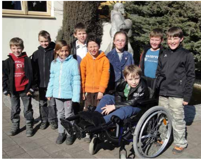
Die Wattenberger Erstkommunikanten

Die Nacherstkommunion in der Säger Kirche wird am 15. Mai 2011 gefeiert.